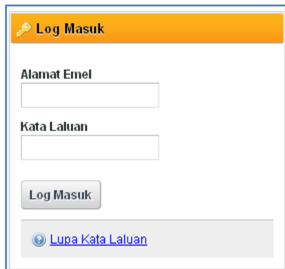
Rajah 1 : Log Masuk ke dalam OAS.

Nota: Sistem OAS ini sesuai dipapar menggunakan perisian pelayar Internet Explorer 9.0 (dan ke atas), Mozilla Firefox 4.0 (dan ke atas) dan Google Chrome 4.0 (dan ke atas) dengan resolusi 1024 x 768.