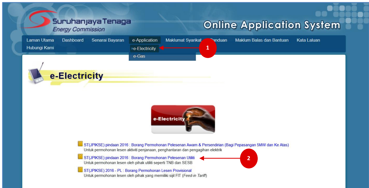
Rajah 2 : Paparan skrin pilihan menu e-Electricity (e-Application).